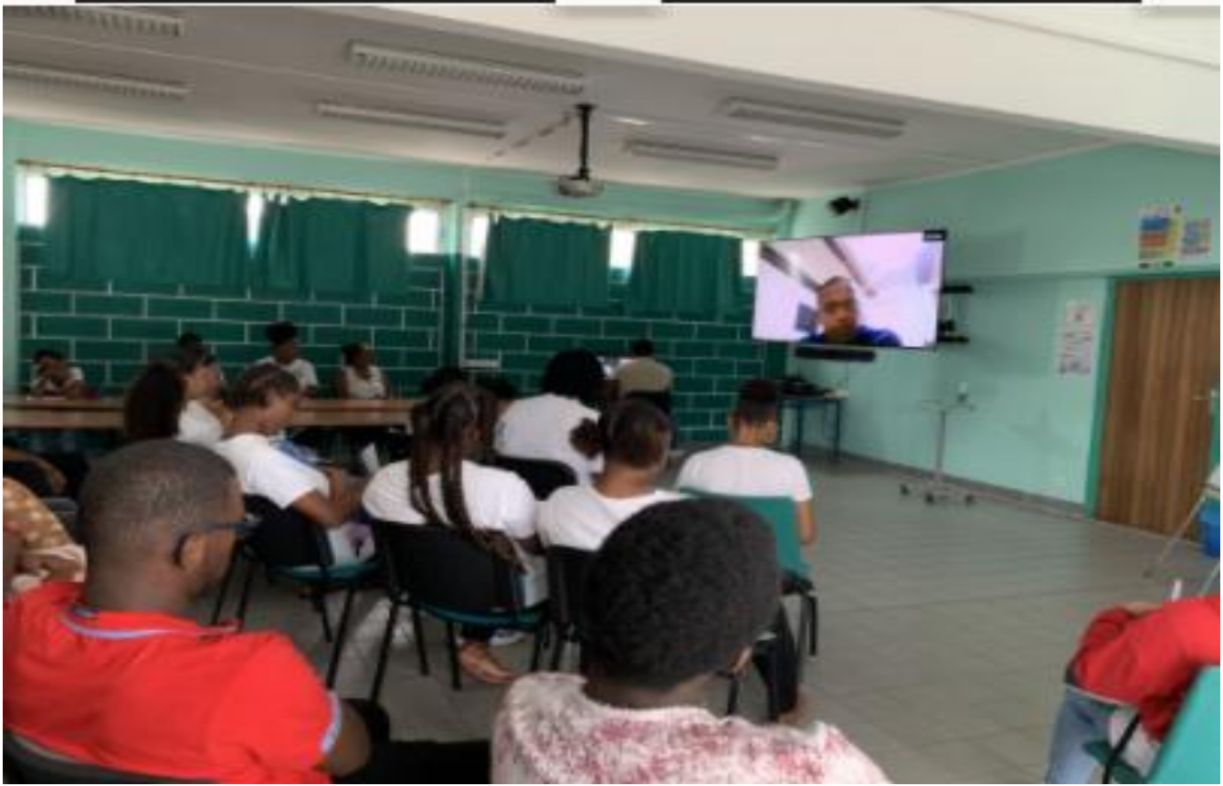
SEMAINE NATIONALE DES CORDEES DE LA REUSSITE : LYANNAJ COLLEGE LYCEE.