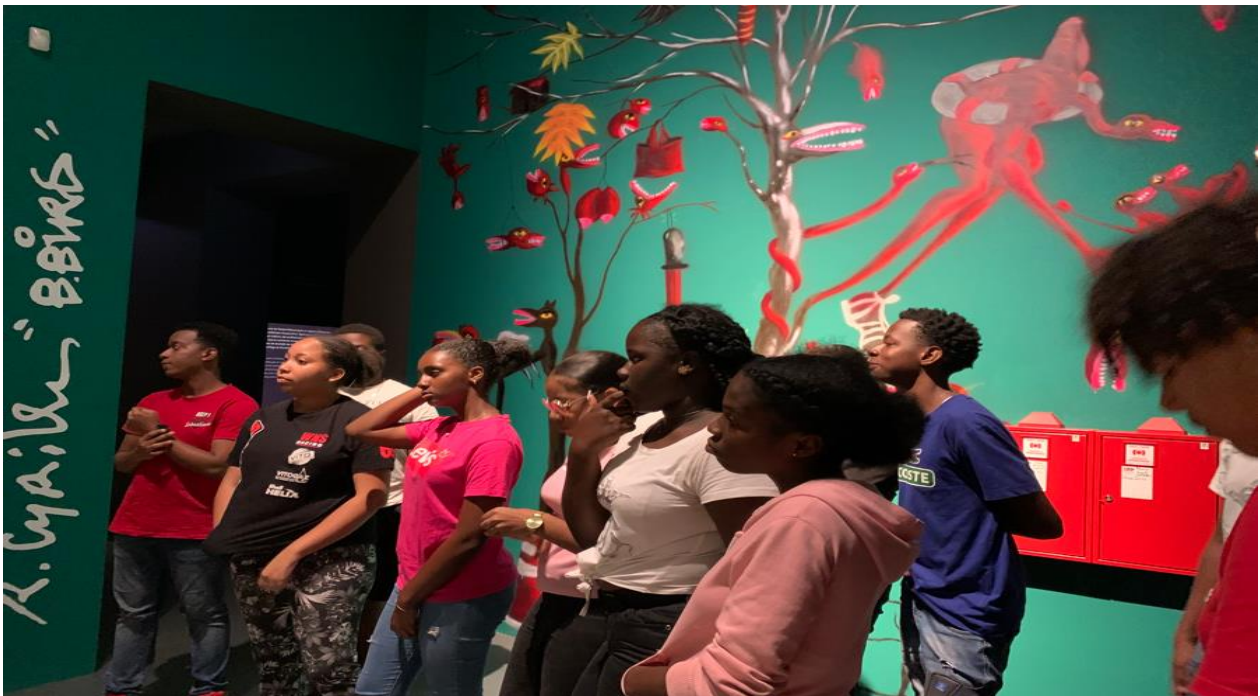
S'approprier l'histoire de la Guadeloupe.