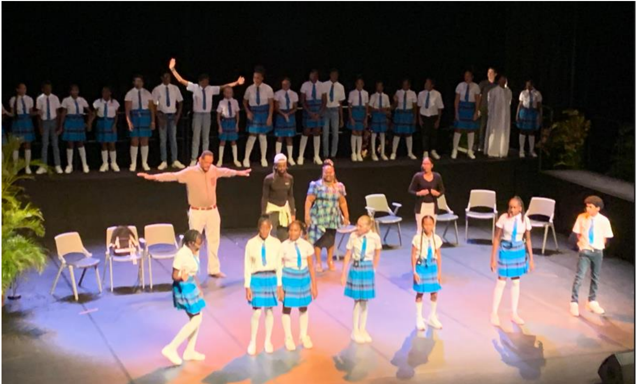
Comédie musicale par les collégiens de Saint-Ruff de Vieux-Habitant. Illustration des situations de handicap.