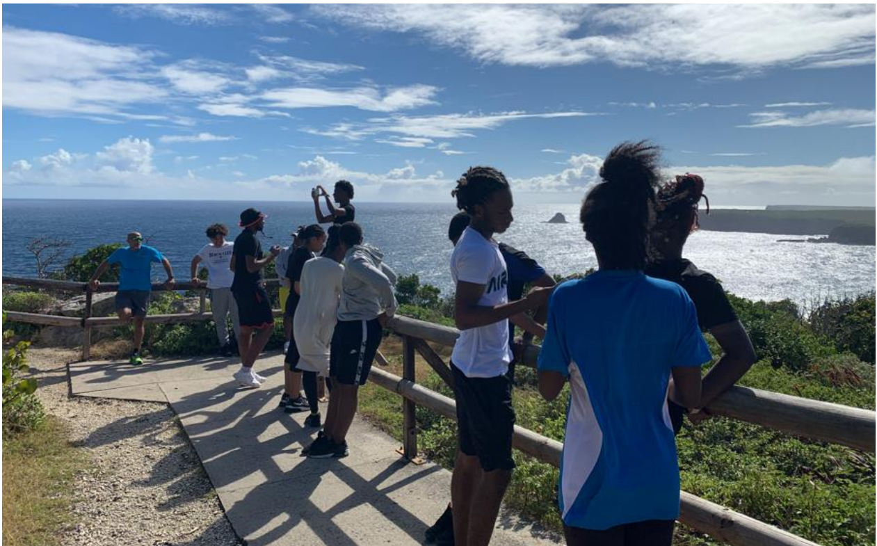
A la découverte des plateaux calcaires du Nord grande -Terre