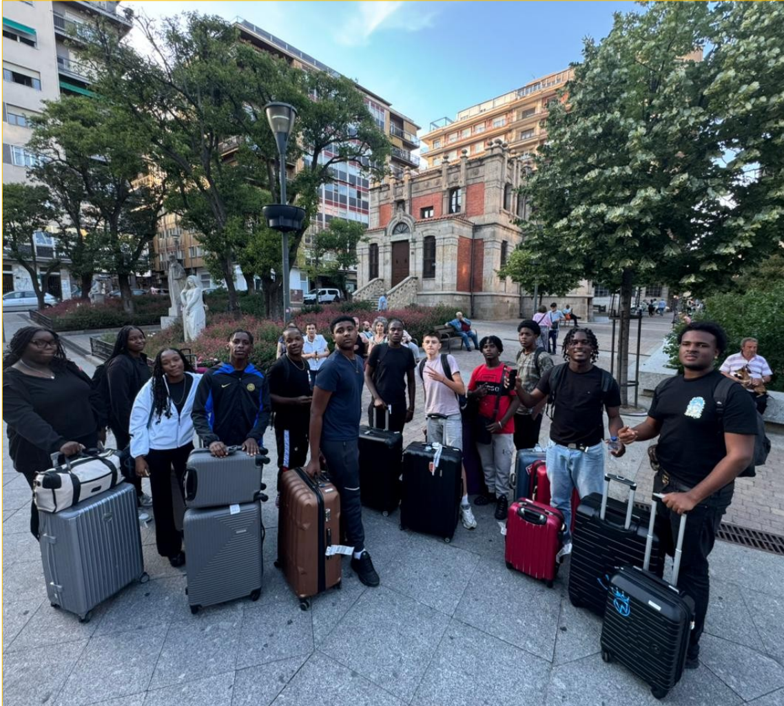
Premiers repères urbains : valises, rues, points de rendez-vous.