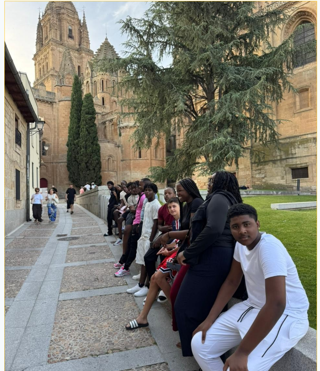
Une ville d'histoire comme cadre d'apprentissage.