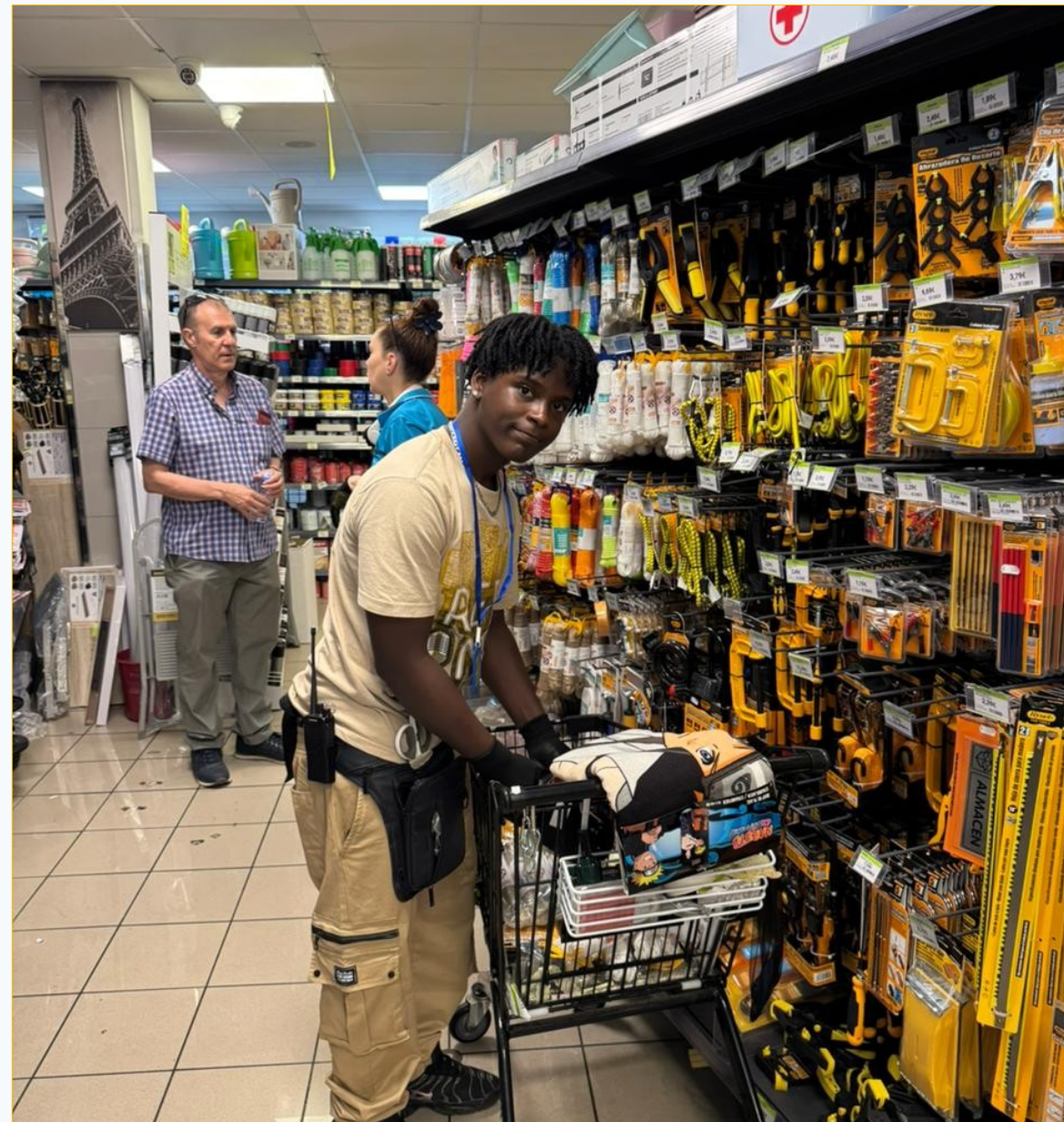
Premiers gestes professionnels : observer, ranger, comprendre les produits, s'adapter aux consignes.