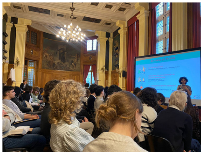
Sensibilisation sur le développement durable