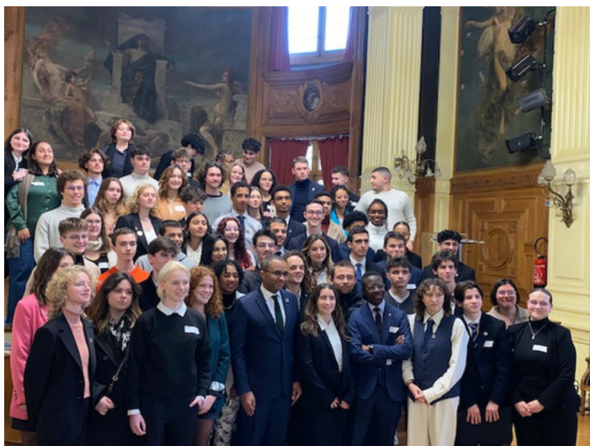
Le ministre de l'Éducation Nationale, Monsieur Pap N'Diaye avec les élus CNVL

Le vendredi 16 Décembre, les élus du CNVL ont participé à une Réunion en distancielle présidée par le ministre de l'Éducation Nationale, Monsieur Pap Ndiaye. Cette visio-conférence a permis de mettre en avant les réflexions et les préoccupations majeures autour du bien-être et du stress.