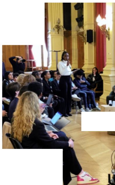
Présentation des travaux de groupe au Ministre de l'Éducation