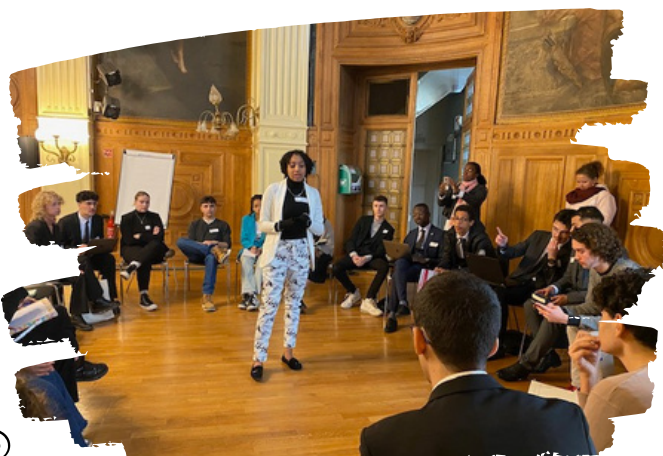
Travail de groupe élus CNVL

Le Ministre a pu recueillir une multitude d'informations et d'avis qui permettront à terme la mise en place de solutions aux divers problématiques évoquées par les élus lycéens. À la fin de cette rencontre les lycéens sont sortis enrichis et satisfaits du moment qu'ils ont passé.