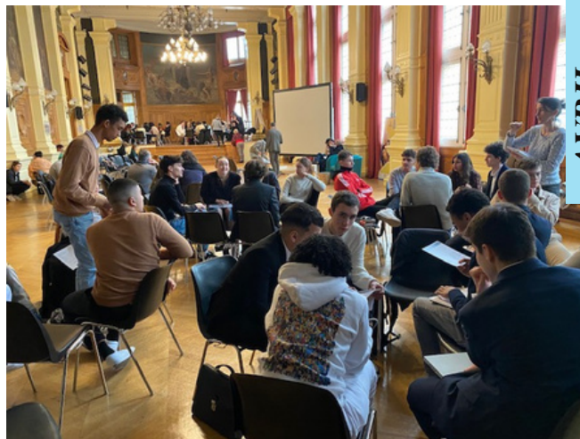
Groupe de travail entre élus CNVL

De nouveaux membres sont élus pour 2 ans depuis la rentrée 2022.