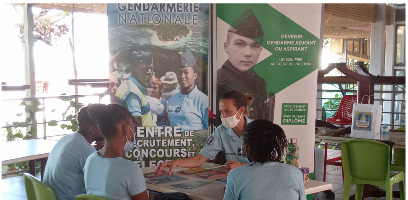
Rencontre avec les gendarmes

Des élèves du collège Bebel ont pu découvrir différents métiers en uniforme et de la justice, le mercredi 2 février 2022 de 8h à 11h, lors d'un mini forum de l'orientation au réfectoire du Collège. Aussi certains ont pu approfondir leurs connaissances sur un des métiers présentés tels que celui de: Pompier, Gendarme, Juge (Magistrat) et les métiers de la Marine Nationale. . Tous à vos agendas pour un prochain mini-forum des métiers au Collège!