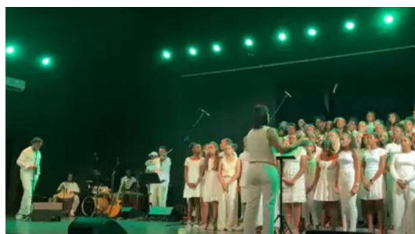
Lien vers la vidéo