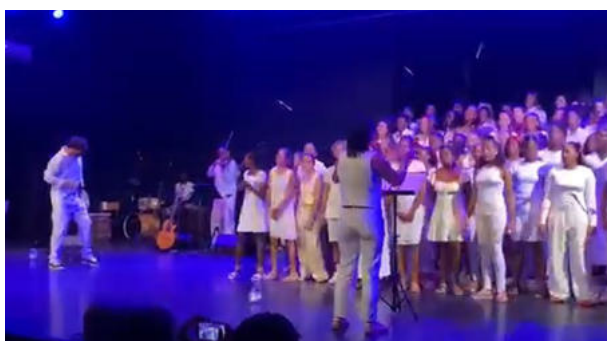
Lien vers la vidéo