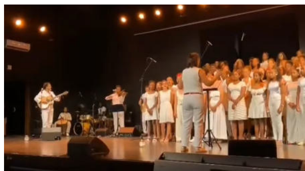
Lien vers la vidéo