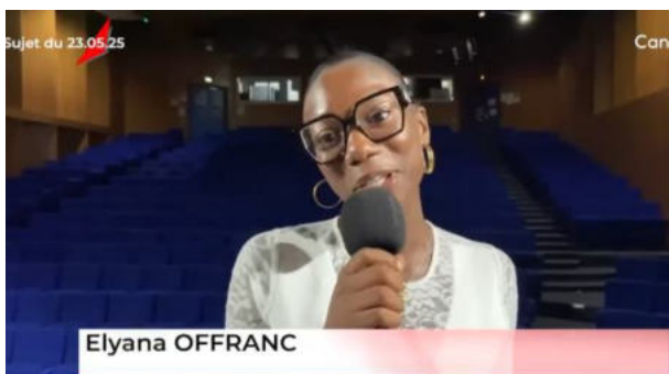
Lien vers la vidéo