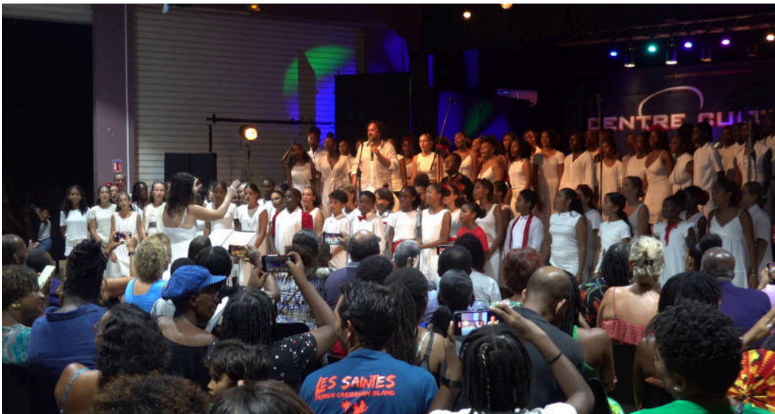
Concert de restitution à la salle Bwa Fouyé au centre culturelle SONIS le 24 Mai 2024