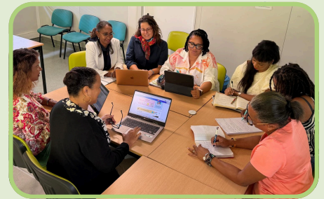
MEMBRES DU COPIL