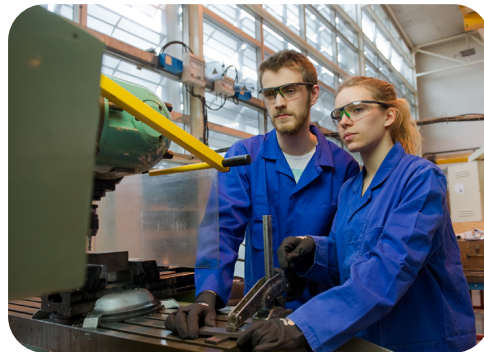
Ci-dessus, un exemple d'image à privilégier.