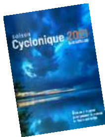
Le livret édité par la COM de Saint-Barthélemy en ligne ici