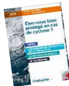
Magazine Soualigapost – édition spéciale 2021 en ligne ici