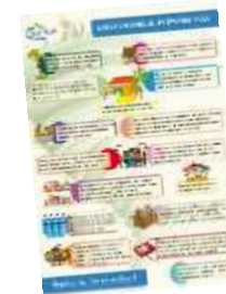
Flyer COM Saint-Martin en ligne ici